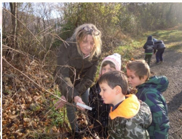
LABORATORIO SCIENTIFICO- MATEMATICO